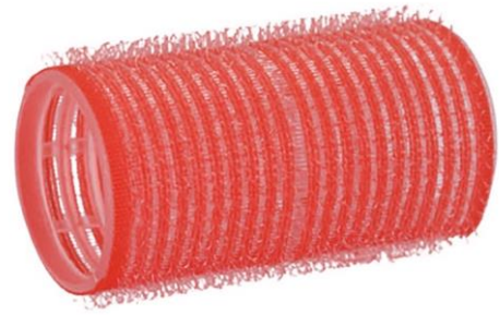
Een ronde wasmand (droogkap) een (op- maak)pop met haar om krullen zetten te oefenen en kleefrollers (groot)